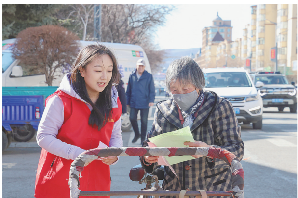
图为工作人员向过往群众发放宣传单,普及法律知识。

活动现场,工作人员通过发放宣传资料、摆放宣传展板、现场答疑解惑等多种方式,向群众普及法律知识。重点宣传《中华人民共和国建筑法》《黑龙江省供热管理条例》等法律法规,聚焦房屋质量纠纷、物业服务