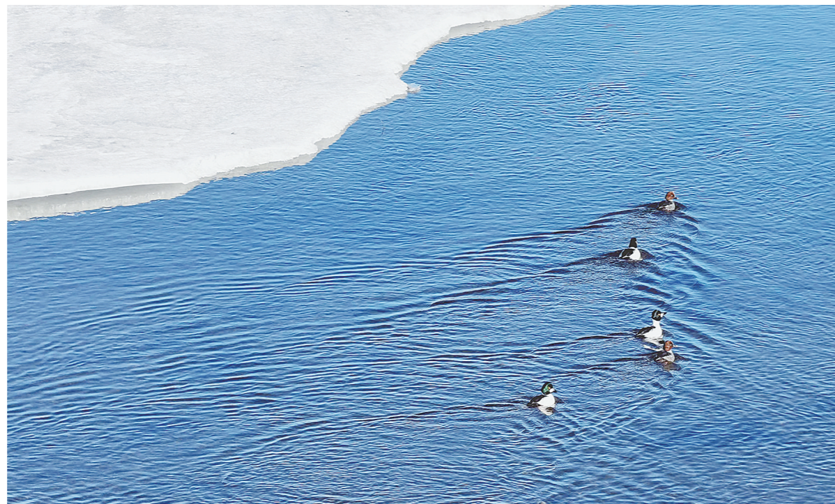
体型较小的绿头鸭在水面穿梭。