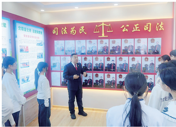
干警为学生们介绍地区中级人民法院发展历史。

本报讯(全媒体记者祁珊珊)近日,地区中级人民法院开展“公众开放日”活动,特别邀请大兴安岭实验中学高一学生代表以实地参观、互动交流的方式,感受司法权威,感悟法治精神,为同学们上了一堂鲜活生动的沉浸式法治教育课。