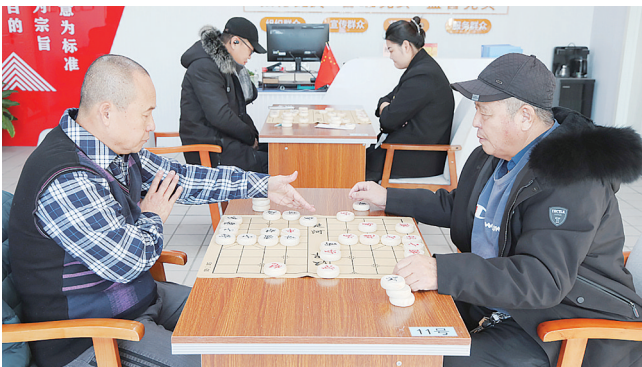
居民正在进行棋盘上的博弈。

梭、炮飞马跳,选手们时而蹙眉深思,谋划着下一步的精妙布局;时而果断落子,尽显从容;时而轻声交流,分享着对棋局的理解。 此次象棋友谊赛的举办,不仅为社区象棋爱好者提供了展示自我的平台,更以棋为媒增进了邻里之间的情谊,让居民在冬日里感受到了社区文化活动带来的温暖与活力,进一步丰富了社区精神文化生活。经过多轮角逐,比赛最终评选出一、二、三等奖及纪念奖若干名。